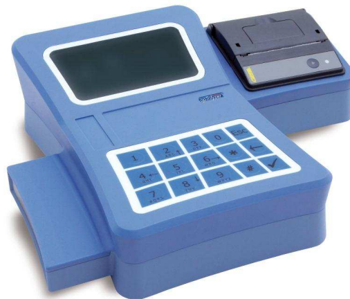
Abbildung 1 LFA Reader

Der LFA (Lateral Flow Assay) Reader ist ein mobiles Messgerät zur quantitativen Auswertung und Dokumentation von ALFA (Allergy Lateral Flow Assay) und AI-LFA (Autoimmune Lateral Flow Assay) , Schnelltests zur Bestimmung von slgE (ALFA) und Autoimmunparametern (AI-LFA)