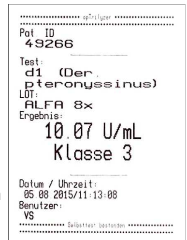
Abbildung 2 Befundausdruck LFA Reader für ALFA